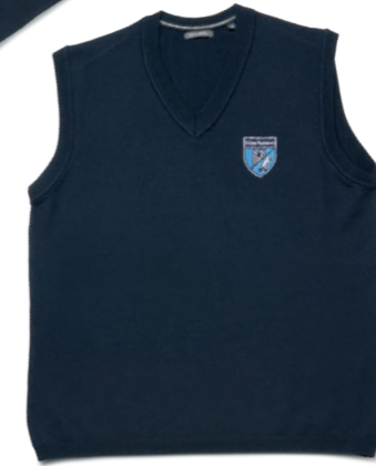
Pullunder dunkelblau (m)