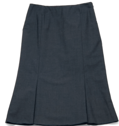
Langer Faltenrock grau