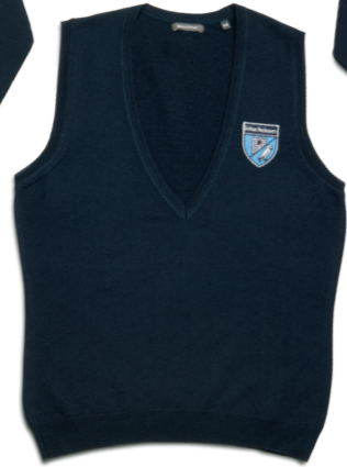
Pullunder dunkelblau (w)