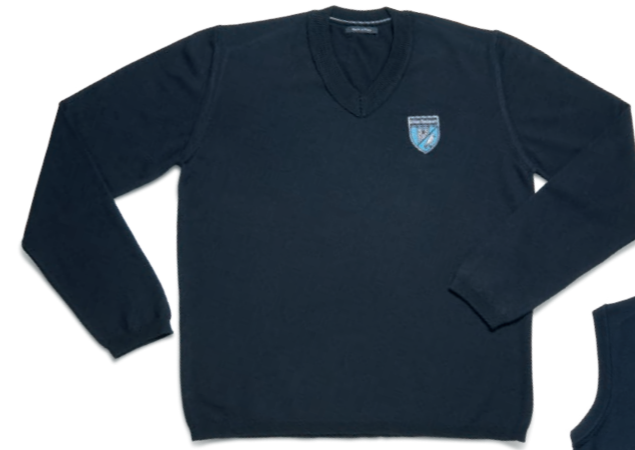
Pullover dunkelblau (m)