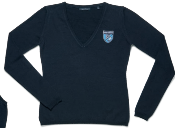
Pullover dunkelblau (w)