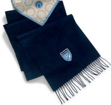
Schal dunkelblau (w/m) in kurz oder lang