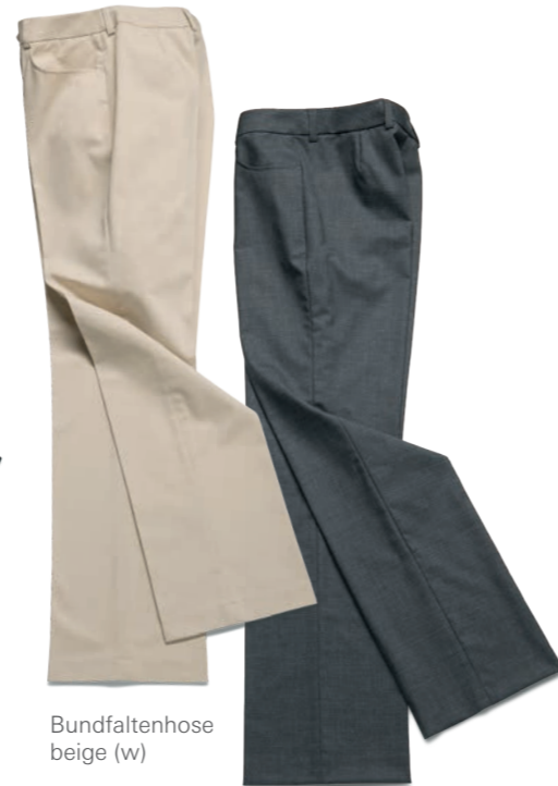
Bundfaltenhose beige (w)