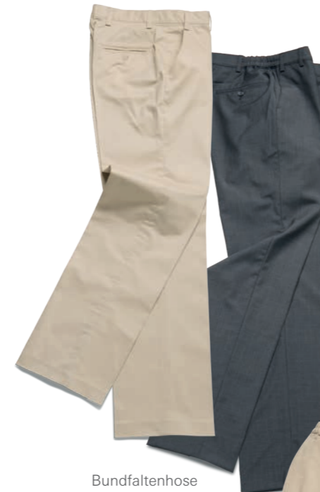
Bundfaltenhose beige (m)