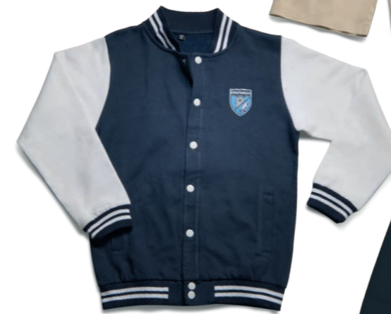
College Jacke (m/w)