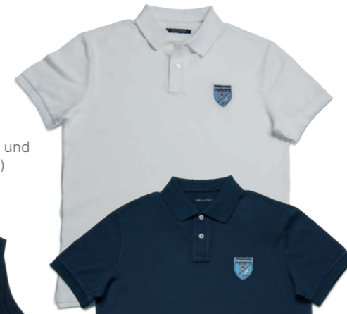
Poloshirt weiß und dunkelblau (m)