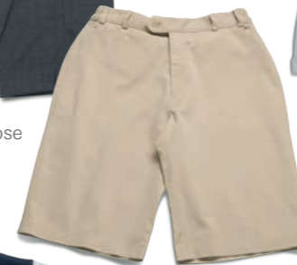
Shorts beige (m)