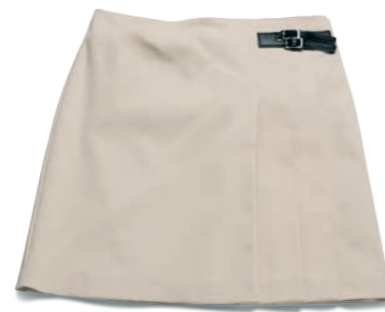
Faltenrock beige mit Riemchen