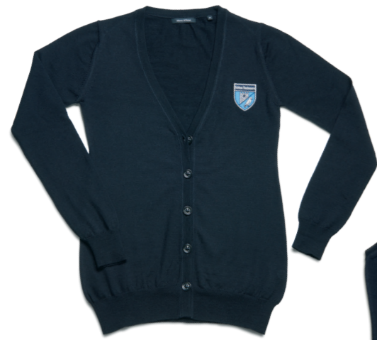
Cardigan dunkelblau (w)